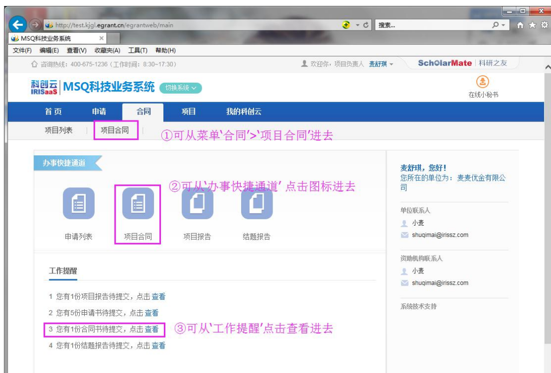
图 4 进入路径

2、项目合同列表：项目负责人登录平台后，可通过以下方式进入项目合同列表；具体操作见图 4、图 5。