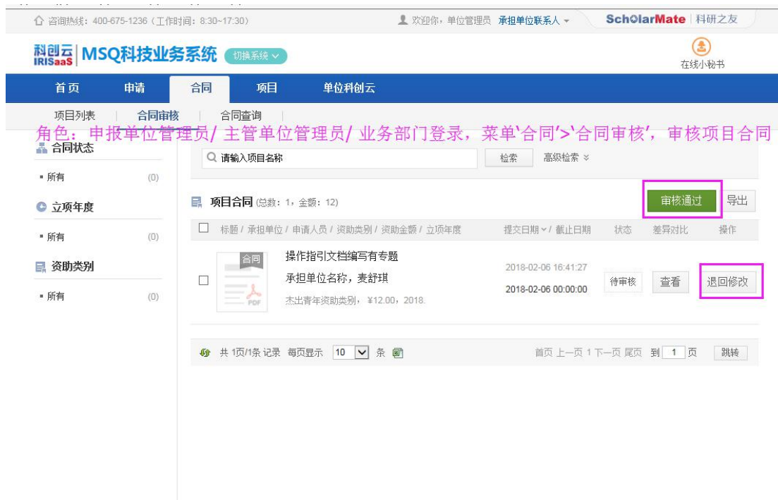
图 7 进入审核