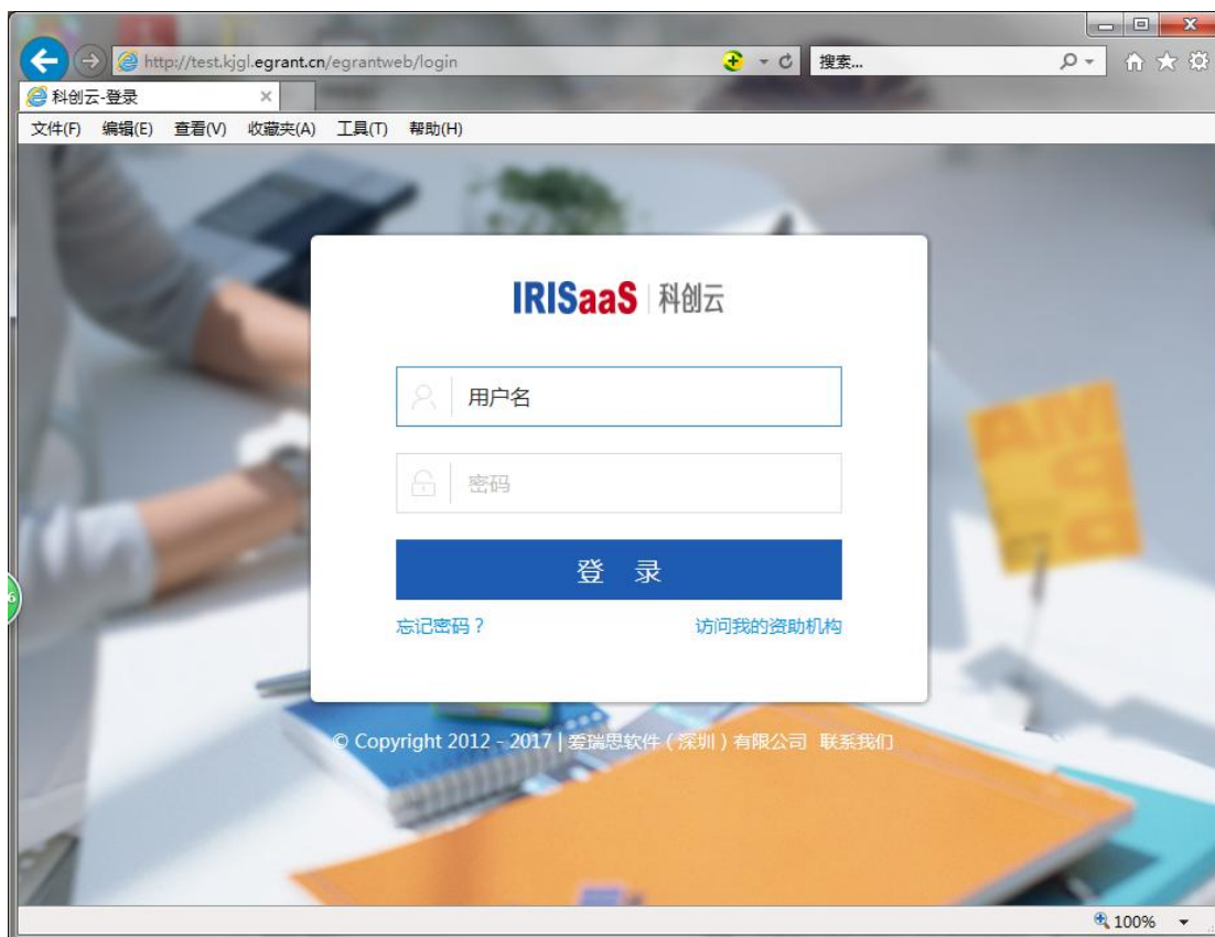
图2 云平台登录界面