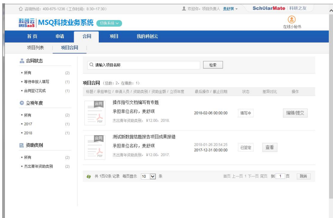
图 5 项目合同列表