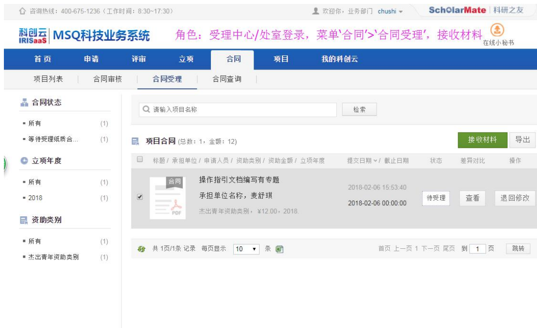
图 9 进入合同受理界面